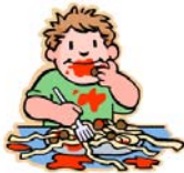
Naast het leren op school

Vooraf werden kaartjes klaargemaakt. Volgende zinnen staan op de kaartjes: